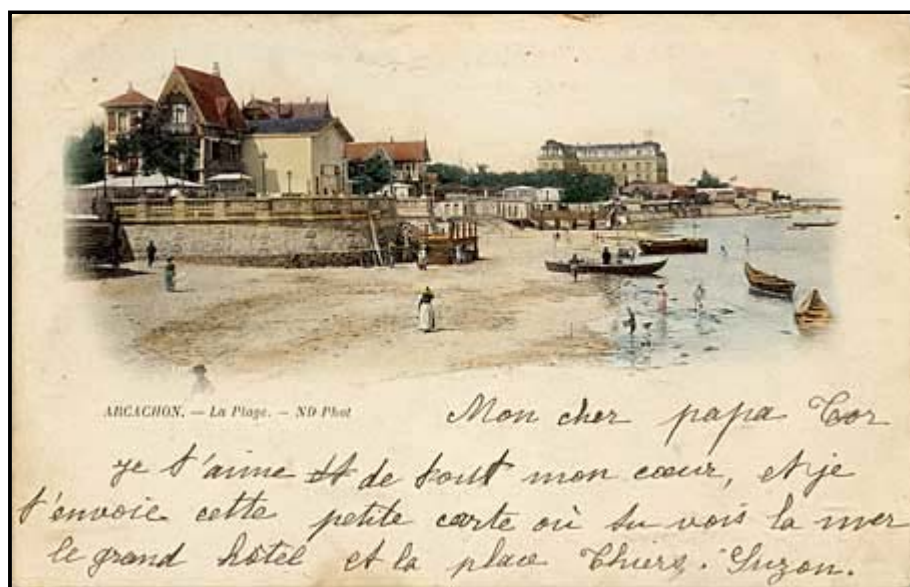
Type 4 : type 2 numérotée