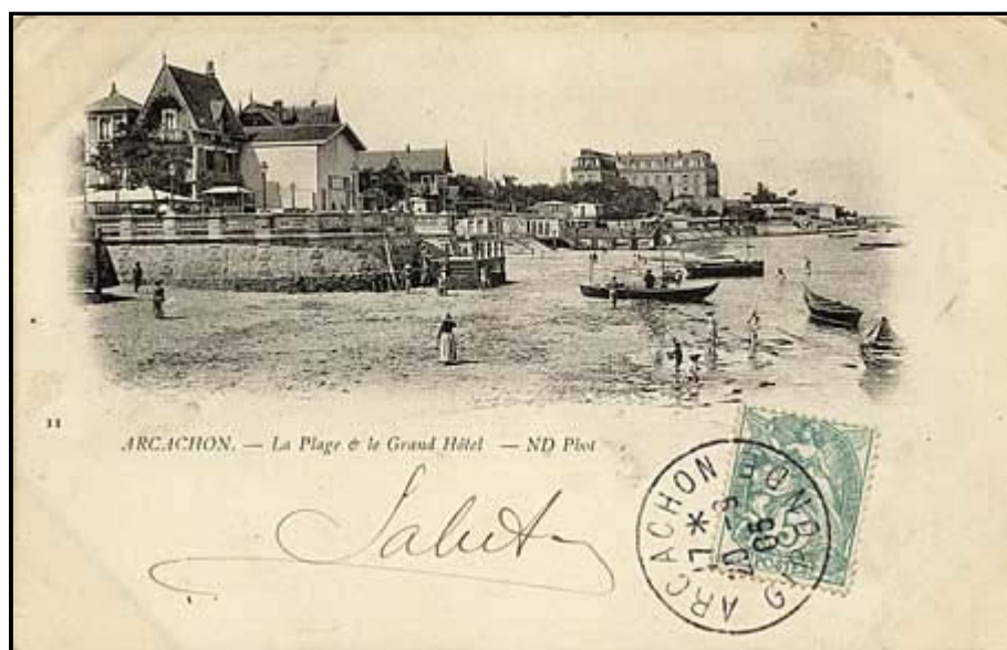
Type 5 : type 4 en couleur