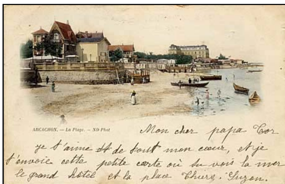
Type 4 : type 2 numérotée